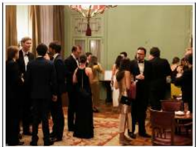
Cena de Gala en los salones de la Real Gran Peña de Madrid