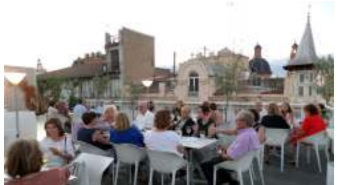
Al finalizar el Torneo los jugadores fueron agasajados con un cóctel en la Terraza del Casino