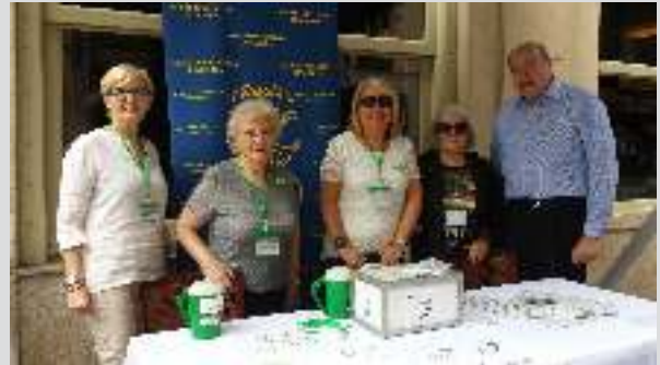
La Secciones de la Sociedad estuvieron presentes