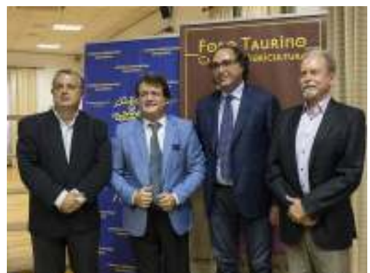
Los ponentes de la conferencia

Con este interesantísimo acto se cerró la Feria de Toros y Cultura que desde el día 26 de junio se ha venido celebrando en el Casino de Agricultura de Valencia y que ha estado organizada por Avance Taurino y el Foro Taurino del propio Casino en colaboración con la Diputación de Valencia.