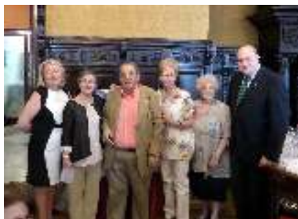
1º clasificadas Lunes