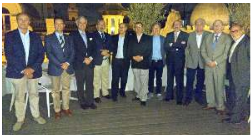
Al finalizar la conferencia, algunos asistentes a la misma, continuaron la velada en la terraza del Casino