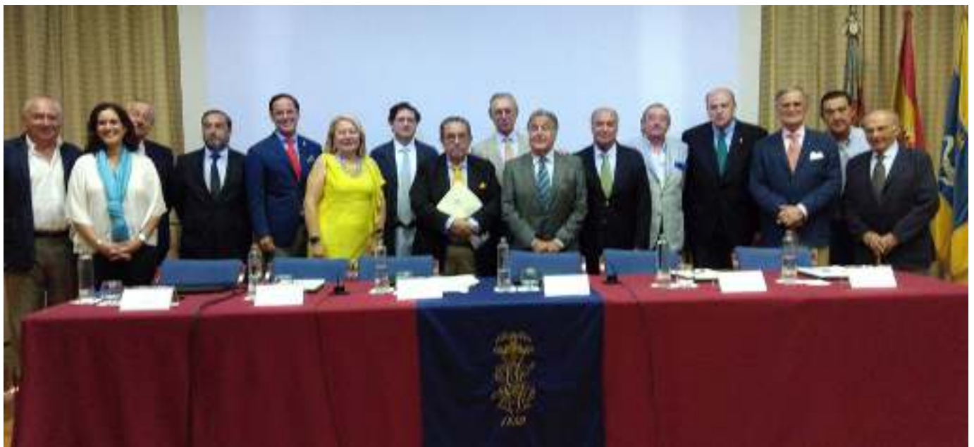
La Junta Directiva de la Sociedad el día de la Asamblea General

"El Casino de Agricultura más vivo que nunca, incrementa el número de actividades y apuesta por el socio más joven, con la nueva categoría de Socio Junior"