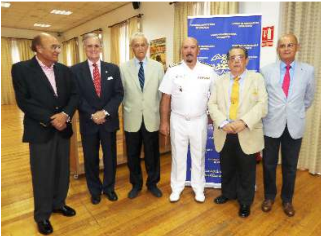
El Comandante Naval de Valencia posando con algunas personalidades que asistieron a la conferencia.