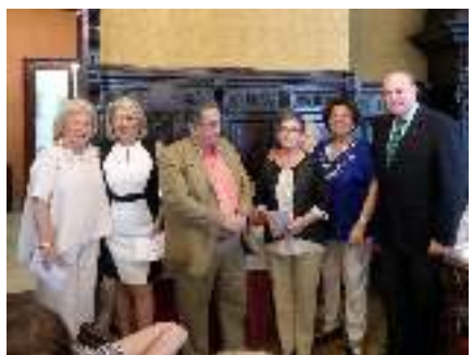
1ª clasificadas Miércoles