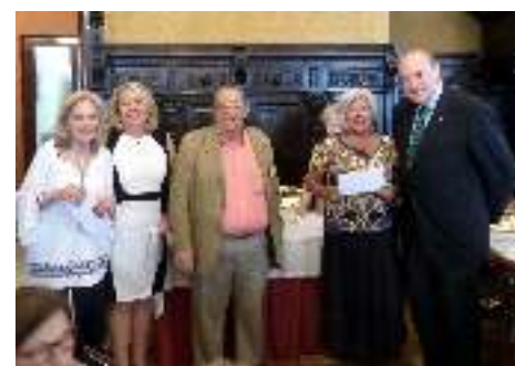
3ª clasificadas Lunes