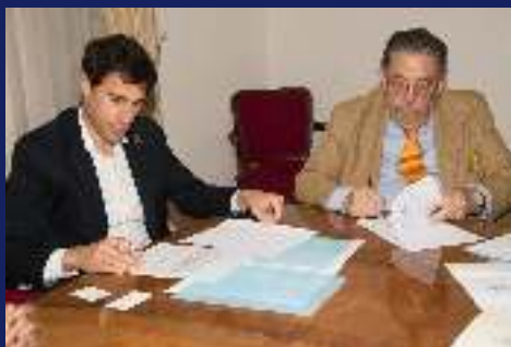
Ampliación de nuevos Convenios sociales