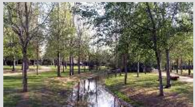
Paisaje de La Rambleta