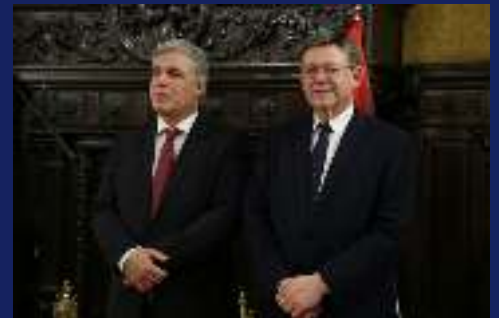
Recepción del Embajador de Uruguay