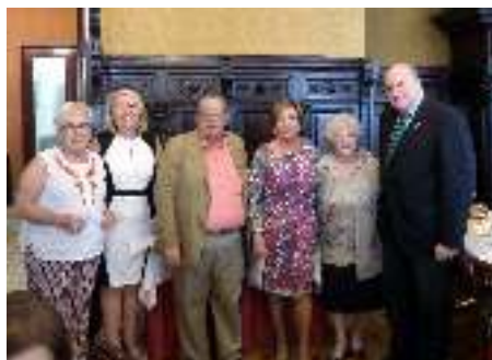
2ª clasificadas Lunes