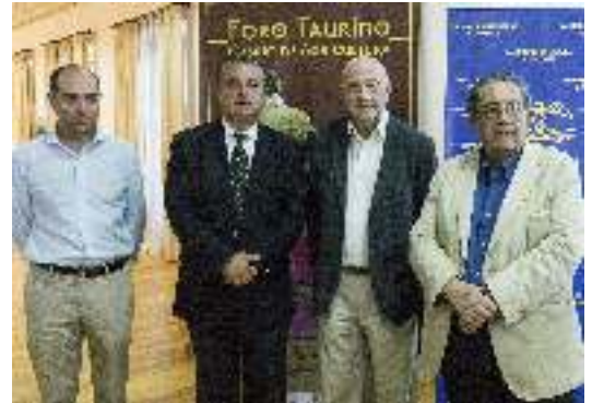
El artista junto a los componentes de la mesa presidencial