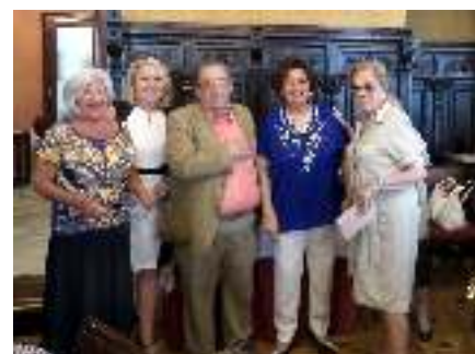
3ª clasificadas Miércoles