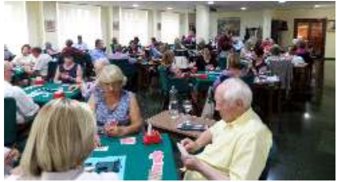
Algunos momentos del Torneo en el que participaron jugadores de distintos Clubs