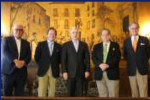
EL Ex Presidente de Colombia D. Álvaro Uribe en la Sociedad