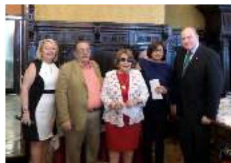
3ª clasificadas Lunes