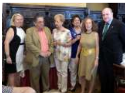
2ª clasificadas Miércoles