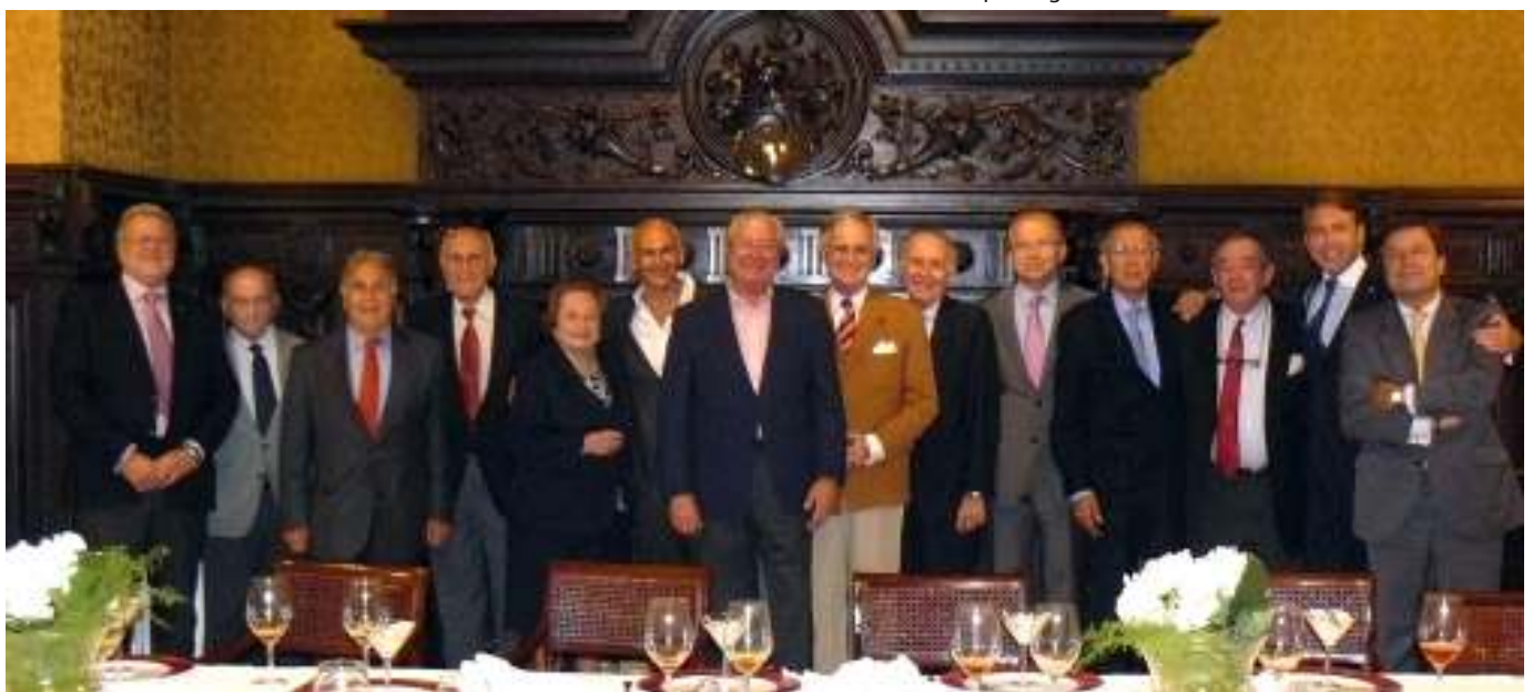
Socios asistentes a la Cata especial de champagnes